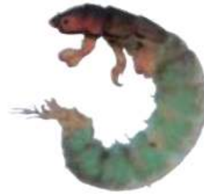
コガタシマトビケラ

頭の先に小さなくぼみがあるのが特徴で、頭と胸は赤茶色をしている。腹は鮮やかなうす緑色から緑がかった茶色、あるいは茶色などいろいろな色をしている。