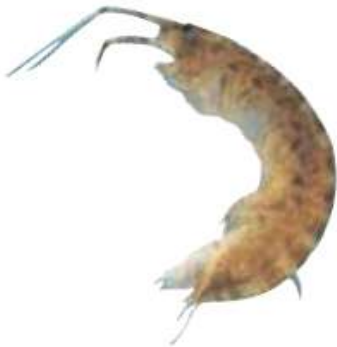
ニホンドロソコエビ