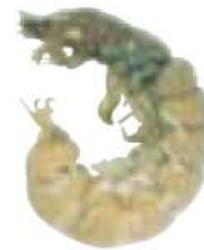
オオシマトビケラ

頭から胸にかけて固く、うすい茶色である。他は茶色から緑色でやわらかく、頭の上部の平たい部分が広いのが特徴。 さなぎは石粒などを使って固めた巣で過ごす。 ●まちがえやすい生物 シマトビケラとまちがえやすい