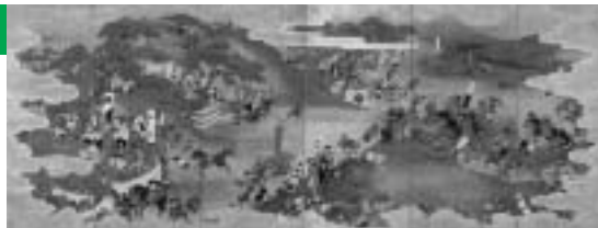
■関ヶ原合戦図屏風・左隻(敦賀市立博物館蔵)