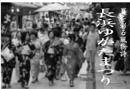
長浜ゆかたまつり