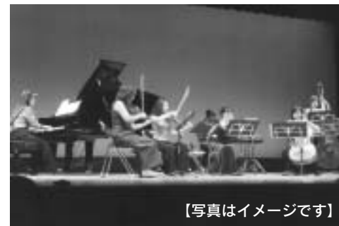
【写真はイメージです】