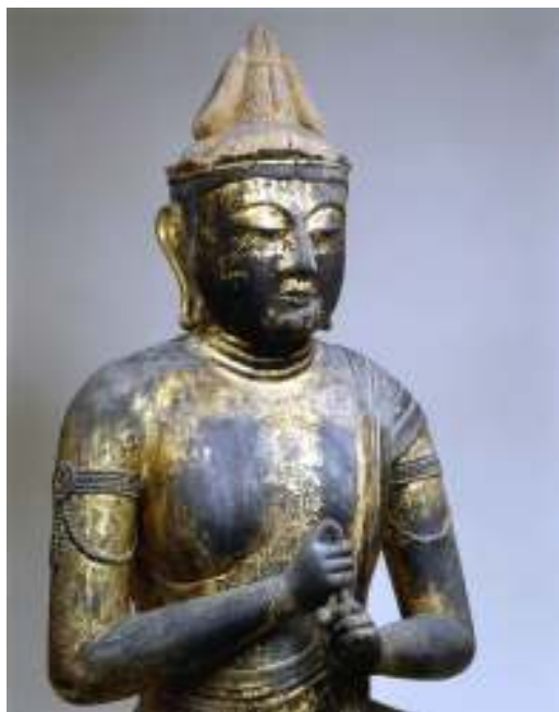
木造 大日如来坐像 1 軀