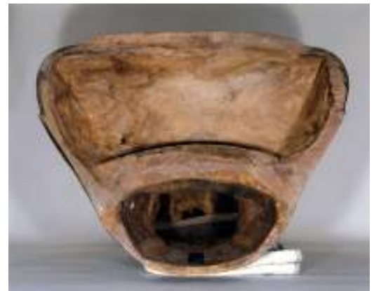
大日如来像底部分写真

いかなる理由でこのような大がかりな修理を受けるようなダメージを負ったのか。もしかすると古い時代の後補なのではないか。さまざまな想像がかきたてられます。