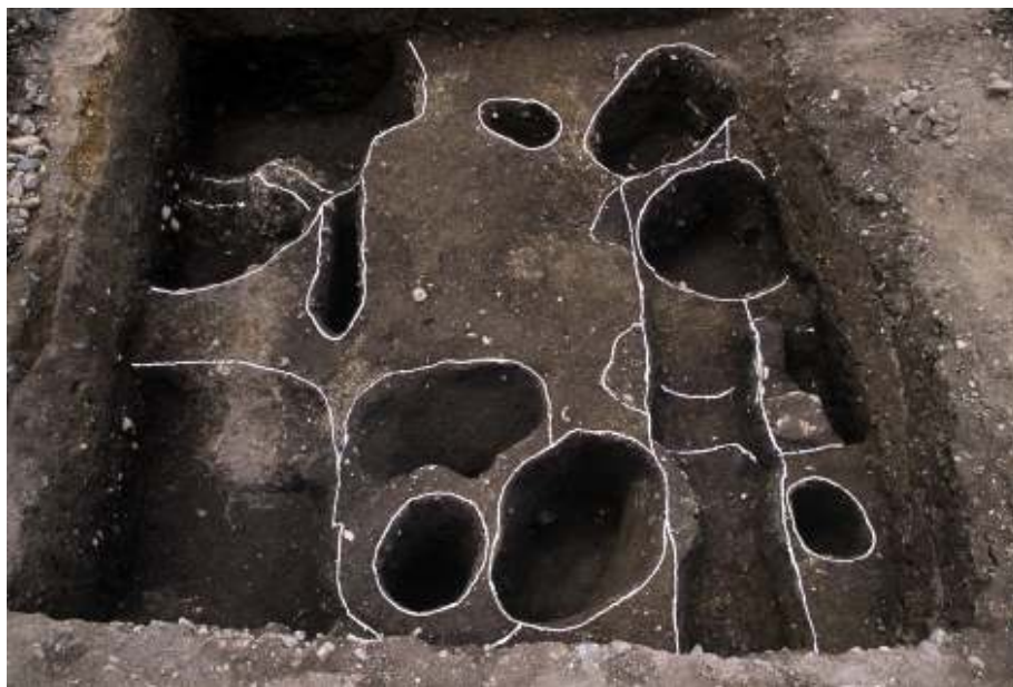
調査区全景写真（北から）

遺構の中からは須恵器 すえき や土師器 はじき 、陶器 とうき などが出土し、遺構の年代は中世 ちゆうせい 以降のものであると考えられます。